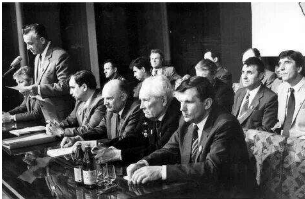
Совещание по поводу 70-летия Таможенной службы СССР.

Управление таможенным делом на территории СССР осуществляло Министерство внешней торговли СССР через входящее в его состав Главное таможенное управление.