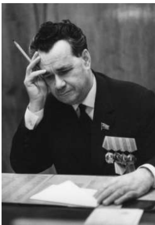
Николай Семенович Патолычев. Министр внешней торговли СССР (1958 - 1985).

Министерство финансов СССР совместно с Министерством внешней торговли СССР разработало положение, в соответствии с которым советские организации, осуществляющие импорт товаров, вносили в союзный бюджет суммы таможенных пошлин, начисленных в установленном порядке. При обложении товаров таможенными пошлинами по максимальным ставкам они не могли быть отнесены на советских заказчиков или уплачивались за счет советских организаций.