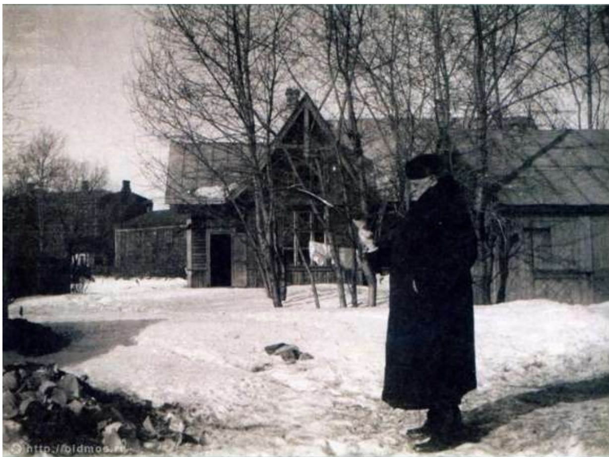
Одна из последних фотографий Саввы Ивановича Мамонтова.

Умер он там же в 1918 году. Погребен в Абрамцево у Спасской церкви.