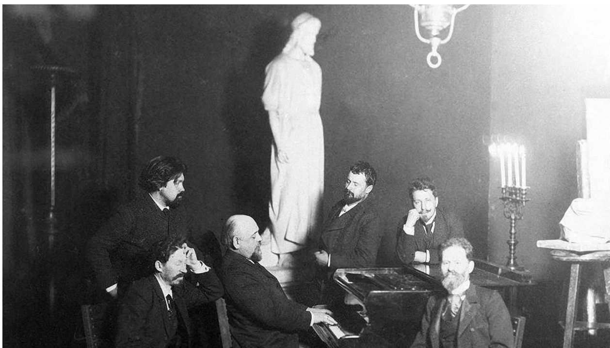
Савва Мамонтов играет на рояле (слева направо) Илье Репину, Василию Сурикову, Константину Коровину, Валентину Серову и Марку Антокольскому.