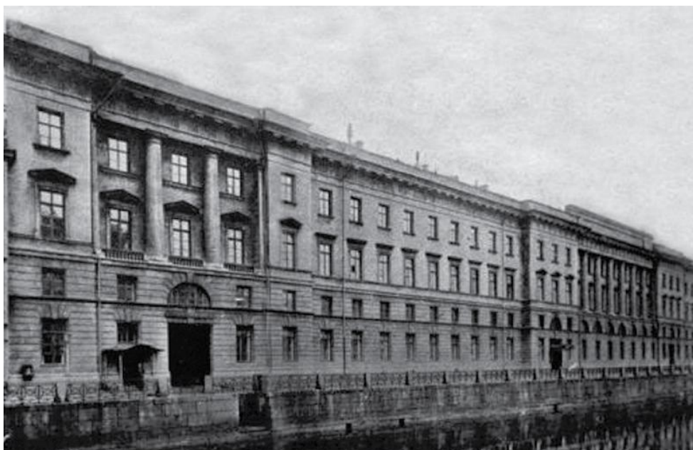
Министерство финансов Российской империи, XIX век.

Быстрый экономический рост на стыке двух веков связан, главным образом, с деятельностью Сергея Юльевича Витте, министра финансов Российской империи в 1892 - 1903 годах.