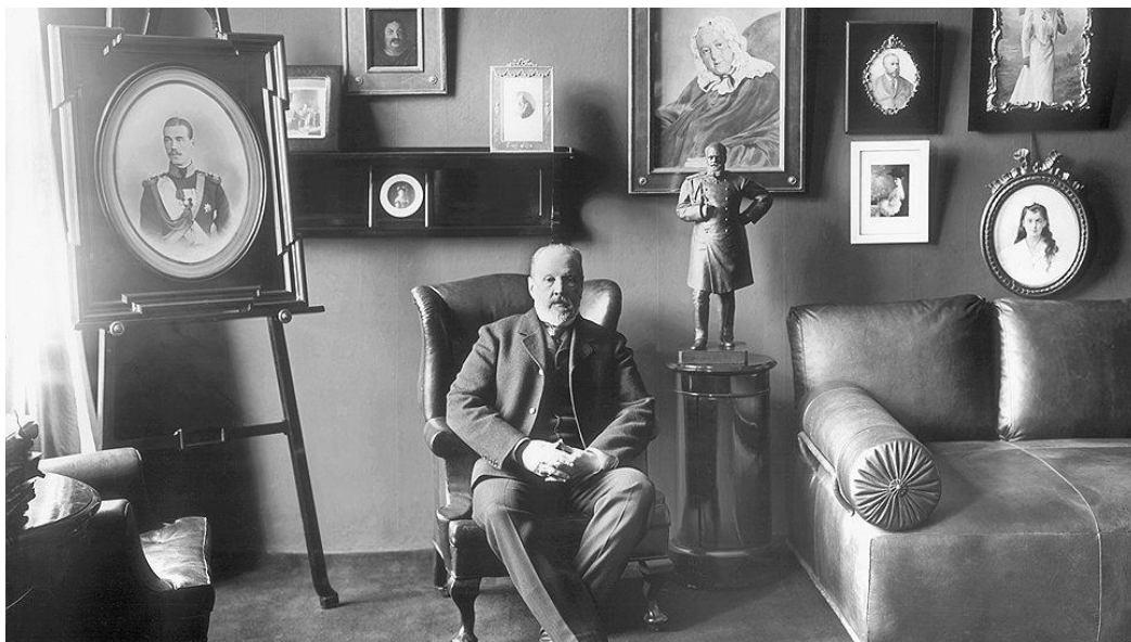
Сергей Юльевич Витте

В 1889 году Сергей Юльевич стал государственным чиновником, заняв должность начальника Департамента железнодорожных дел. Карьера Витте шла вверх: через три года он министр путей сообщения, а с осени 1892 по 1903 год – министр финансов.