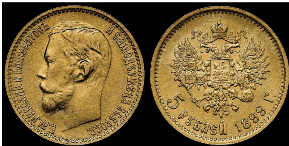
Золотые пять рублей Николая II.

Непреклонная воля, профессиональная компетентность, знание механизмов власти дали С. Ю. Витте возможность разработать проект реформы и добиться поддержки императора Николая II.