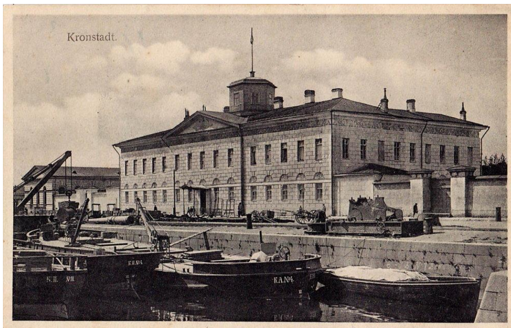
Здание Таможни. Кронштадт. 1900 год

Целенаправленная экономическая и финансовая политика привела к тому, что на 1 января 1897 года золотой запас России достиг 814 миллионов рублей, и появились следующие предпосылки для проведения денежной реформы: