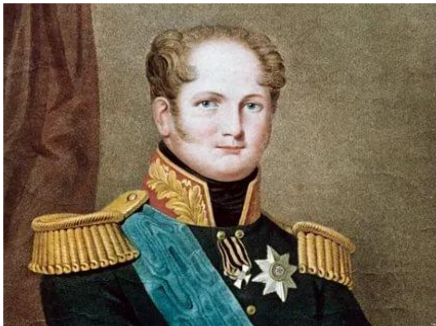
Александр I (1777 - 1825)

вступил на престол в ходе дворцового переворота в 1801 г.