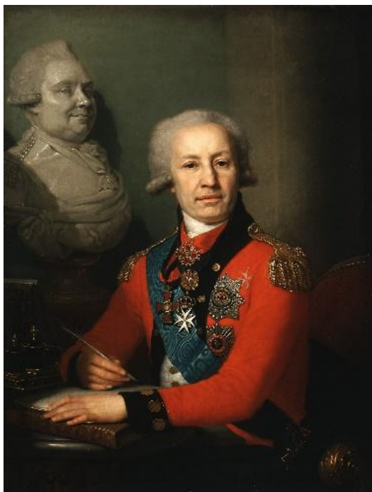
Первый министр финансов России граф Алексей Иванович Васильев.

В 1811 году управление финансами было разделено между тремя ведомствами: Министерство финансов занималось всеми источниками доходов, Государственное казначейство ведало расходами, Государственный контролер занимался ревизией всех счетов.