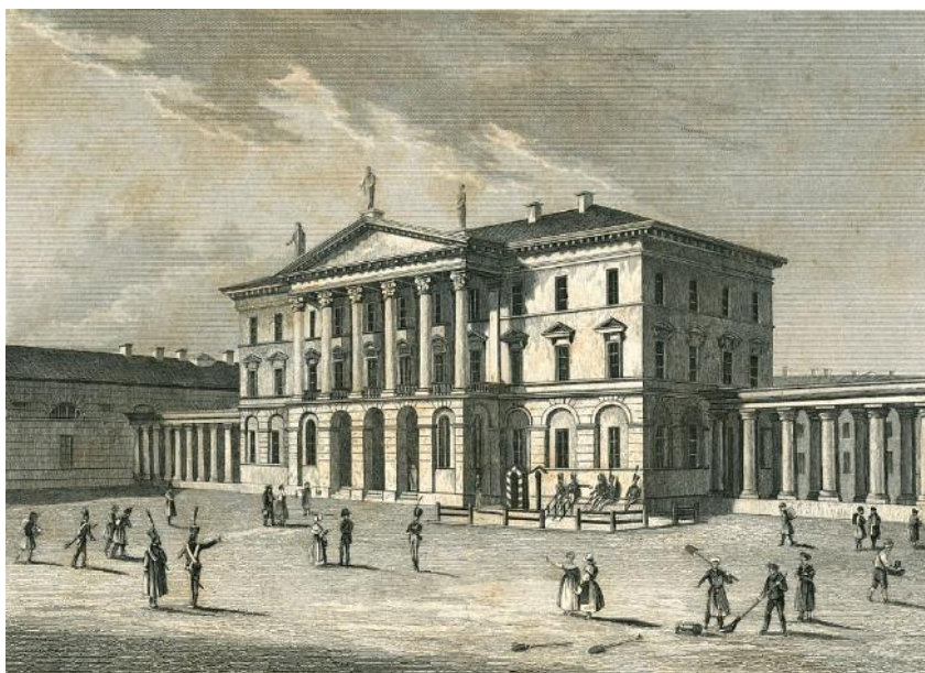
Ассигнационный банк. Санкт - Петербург.

Во-первых, были впервые введены государственные бумажные деньги – ассигнации. Екатериной II был издан специальный манифест, где было сказано: «С 1 января 1769 года устанавливается в С-Петербурге и Москве два банка для вымена государственных ассигнаций».