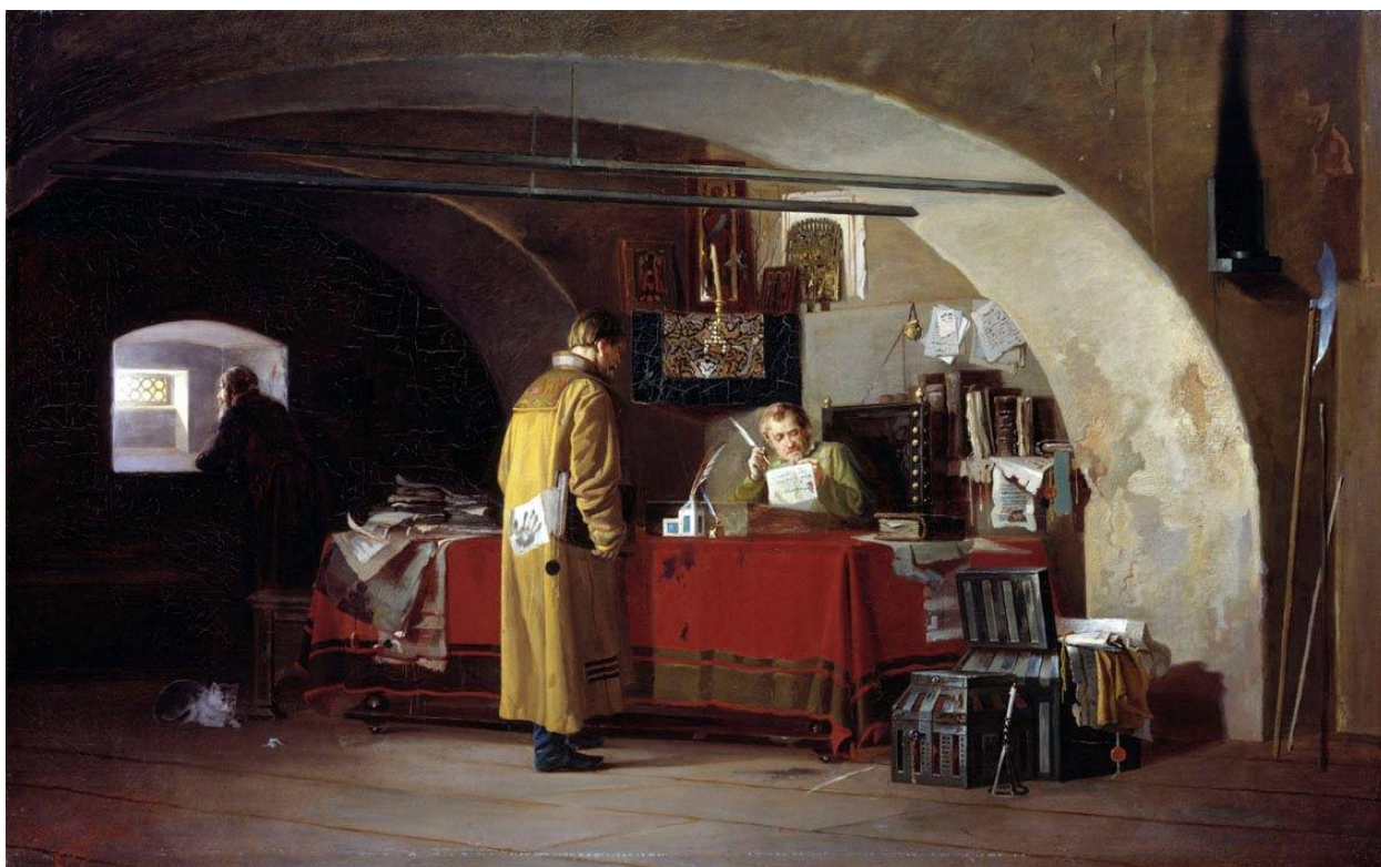
«В Приказе». Художник Александр Степанович Янов.

В 1537 году правительство создало центральное финансовое ведомство - Казну или Казенный приказ. В его управление входило производство и хранение ценностей царской казны, торговые операции для царских нужд, финансирование государственно важных проектов.