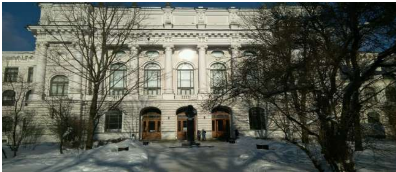
Ленинградский политехнический институт.

кафедрой статистики Ленинградского инженерно-экономического института. В последние годы жизни В.В. Новожилов руководил Лабораторией систем экономических оценок Ленинградского отделения Центрального экономико-математического института АН СССР.