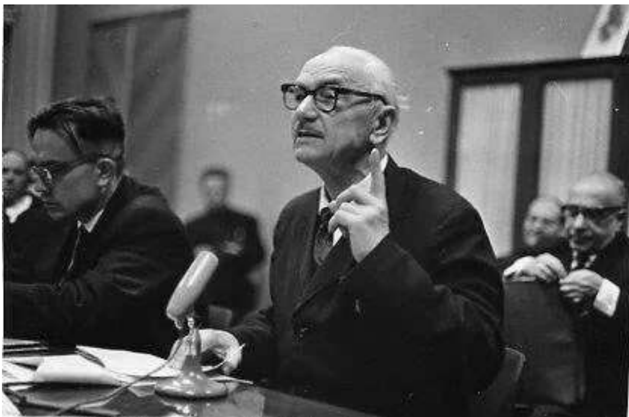
Виктор Валентинович Новожилов (1892-1970).

Виктор Валентинович Новожилов родился в Харькове в семье крупного чиновника Министерства финансов.