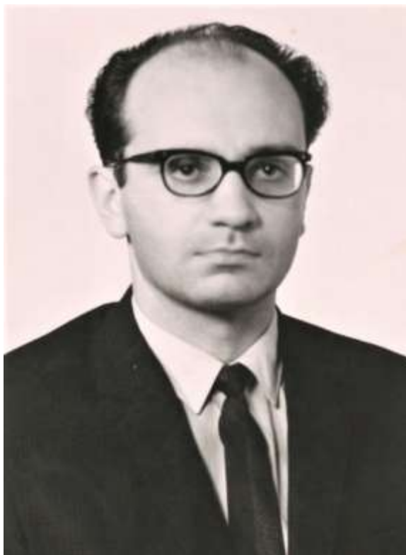
Анчишкин Александр Иванович

(11.09.1933 – 24.06.1987), советский экономист, специалист по теории воспроизводства и экономическим проблемам научно-технического прогресса.