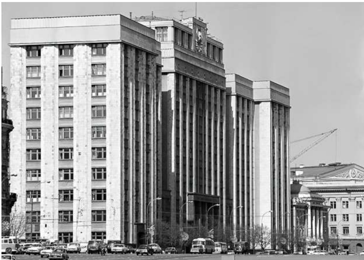
Здание Госплана

В 1958 году С.С. Шаталин с отличием закончил экономический факультет МГУ. Затем ещё почти год С.С. Шаталин провёл как «студент» шестого курса экономического факультета Ленинградского университета, слушая лекции по использованию математических методов в экономике, в том числе и лекции будущего лауреата премии имени Альфреда Нобеля профессора ЛГУ Л.В. Канторовича.