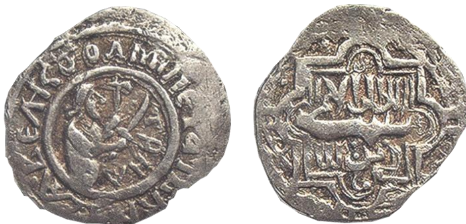
Проволочные монеты времен Дмитрия Донского.

Княжеский портрет исчезает во время правления Ярослава Мудрого, сменившись изображением святого Георгия. Так что прообраз современных копеечных номиналов зародился уже в те древние времена. Правда, здесь Георгий, как мы видим выше, еще не восседает на коне и не разит змея.