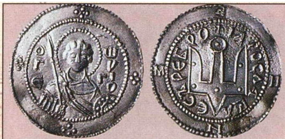
Монета с изображением святого Георгия.

Историки говорят, что наиболее вероятный период для этого наступил в конце десятого века. Для их изготовления использовали драгоценные металлы - золото и серебро. Это обусловило их названия «златники» и «сребреники», но это вовсе не означает, что так их именовали в княжеские времена. Просто так удобнее было описывать их при изучении древних монет. Впрочем, данные позже названия не так уж далеки от истины. К примеру, на монетах, датируемых периодом с 980 по 1015 год, присутствует надпись: «Владимир на столе, а се его сребро». Конечно же, великий князь не выплясывает на столе, а этим словом обозначен более пристойный ему «престол». Если с одной стороны монеты присутствовал княжеский портрет, то с другой мы можем увидеть герб княжества, имеющий форму трезубца или двузубца (поздние экземпляры), или Иисуса Христа (ранние экземпляры). Родовой знак Рюриковичей над плечом князя не был константой, а нес в себе изменения, связанные с тем, кто в данный момент находился на престоле. Вес золотой монеты был чуть легче четырех с половиной граммов. А у сребреников присутствовал целый монетный ряд, где масса менялась от 1,7 до 4,68 грамма. После княжения Владимира золото перестало использоваться для выпуска монет. Серебряные же деньги закрепились в обороте, их принимали к оплате уже и за пределами Киевской Руси, что заметно облегчало купеческую жизнь.