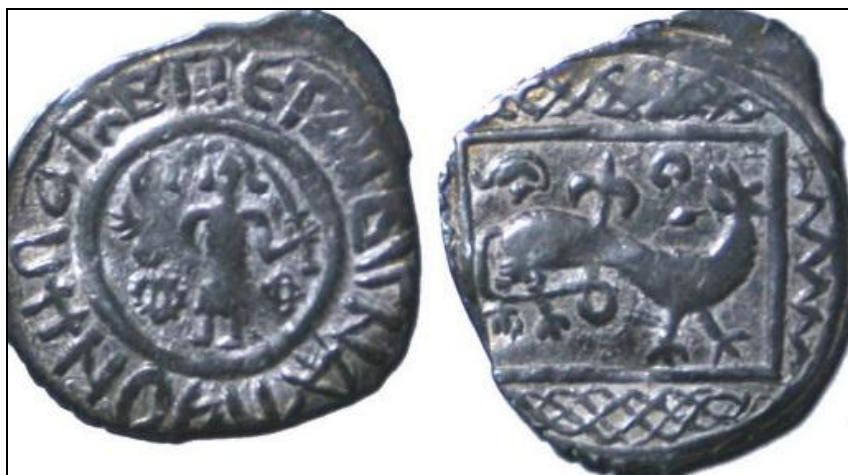
На монетах изображались сцены охоты, мифические животные (Грифоны и Химеры).

Рязанское, Тверское, Серпуховское, Переяславское, Ростовское, Ярославское и ряд других княжеств чеканили свои монеты. Каждый удельный князь с помощью определённых сюжетов на монетах и надписей с титулами обозначал свои амбиции и притязания на роль в Российском Государстве.