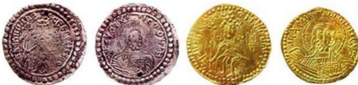
Фотографии монет Древней Руси – серебряник и златник.

Когда же появились на Руси первые деньги?