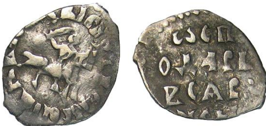
Русская монета, выпущенная в конце XV века.

На Руси же вплоть до конца XV века монету могли чеканить специальные купцы-денежники: им следовало самостоятельно раздобыть металл, найти рабочих и организовать производство, после чего князь мог разрешить поместить им свое имя на монеты. Из-за такой системы возникало огромное количество самых разных монет, которые были совершенно не похожи друг на друга и тем более не были равны по своей ценности.