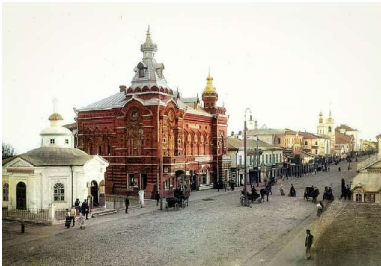
Город Владимир,. XVIII век.

В это же время Безобразов исполнял различные поручения по Министерству финансов. Его командировали в разные губернии для сбора сведений об отношении землевладельцев к учреждению земских банков и о финансовых оборотах приказов общественного призрения; в 1861 году он получает новую командировку для изучения вопроса об учреждении на новых основаниях должностей губернских механиков.