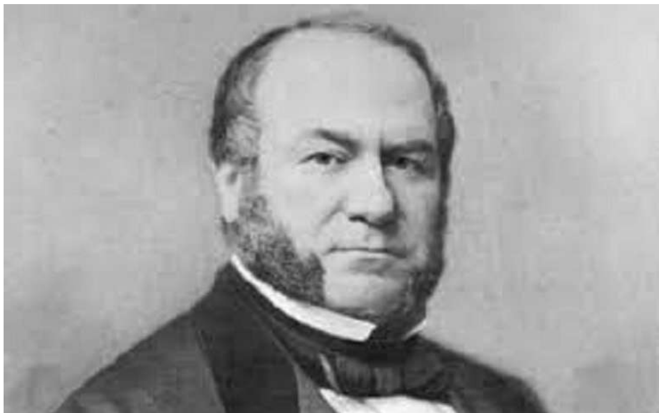
Александр Людвигович фон Штиглиц.

Основной капитал банка определялся в 10 миллионов рублей и был распределён на 40 тысяч акций по 250 рублей каждая. Первая половина из них подлежала первоначальному выпуску, вторая могла быть выпущена позже по постановлению общего собрания акционеров и с разрешения министра финансов.