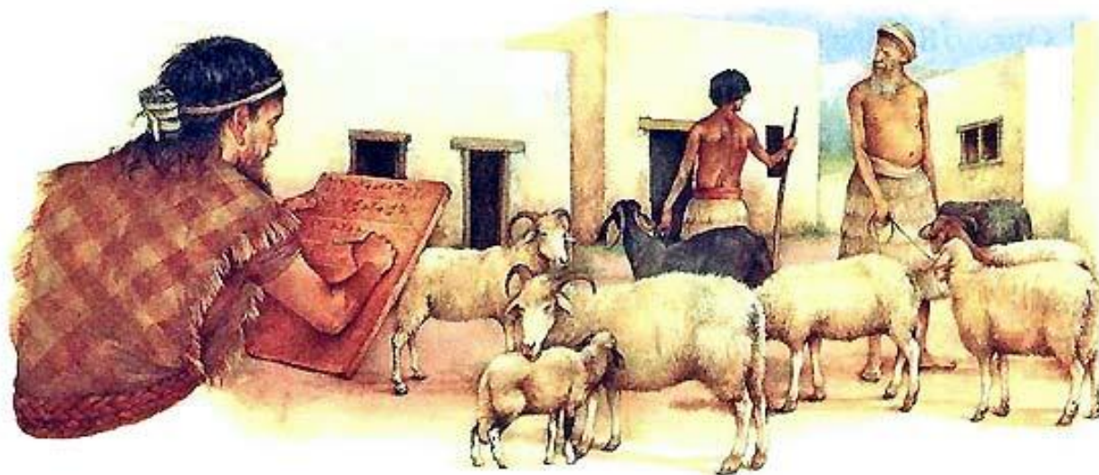
Учет в натуральных величинах.