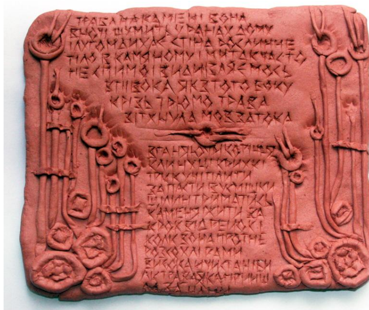
В Вавилонии бухгалтеры записывали данные учета на глиняных табличках.