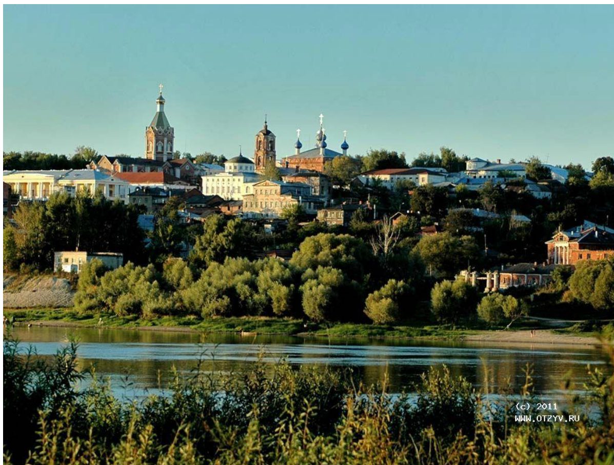
Вид с Оки на Касимов сегодня.