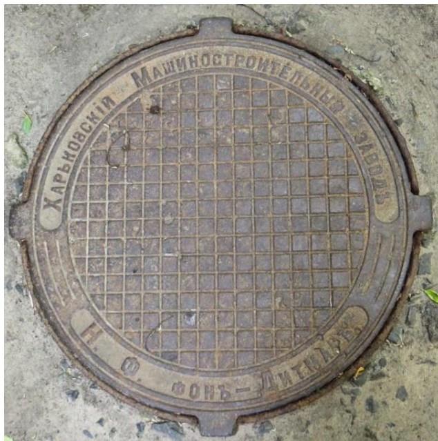
Люк с завода Николая фон-Дитмара (ныне «Свет шахтера») на обычной харьковской улице.