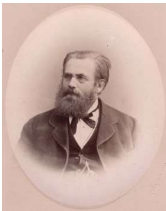
Иван Василевич Вернадский (1821-1884).