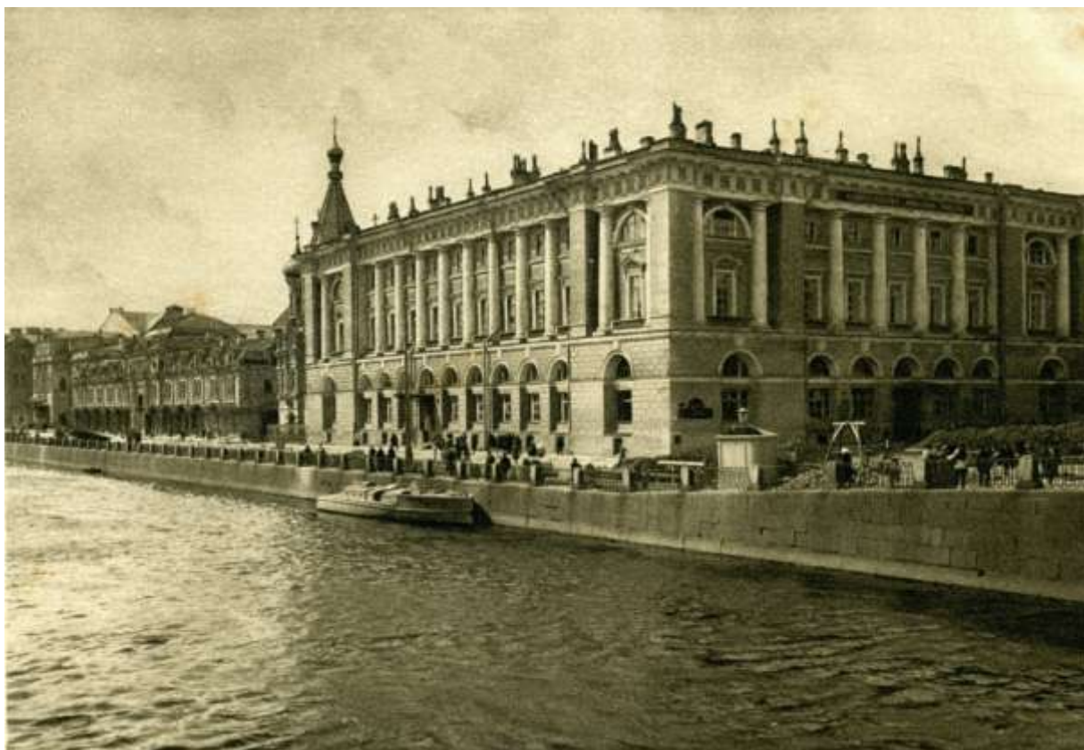
В этом здании Санкт-Петербурга размещалось Министерство внутренних дел Российской Империи, открытка 1929 года.

Одна из главных экономических работ И. Вернадского - «Проспект политической экономии» (СПб., 1858) - представляет собой развёрнутую программу курса политической экономии в том виде, как она излагалась в то время автором студентам. Сам предмет политической экономии он определял так: «Политическая экономия, как наука, в настоящий момент своего развития есть по преимуществу теория труда, или теория ценности».