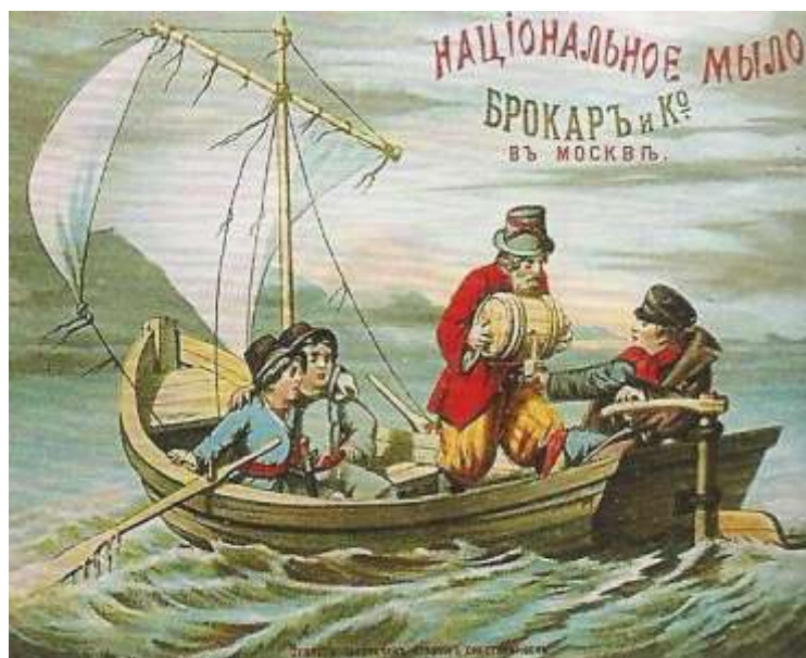
Реклама мыла фирмы Броккар.