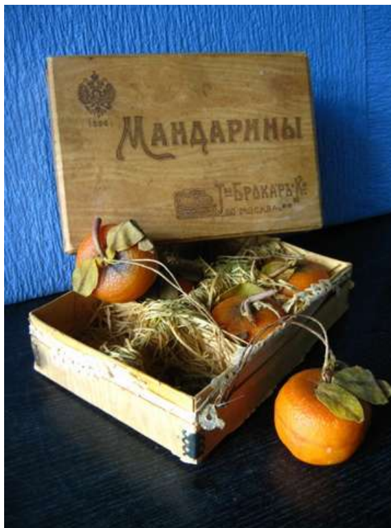
Мыло в форме мандаринов фабрики «Товарищества Брокар и Ко». Одновременно - ёлочная игрушка и забавный сувенир.

Генрих Брокар известен также как изобретатель: открыл новый способ изготовления концентрированных духов, изучал воздействие духов на человеческие эмоции, придумал несколько новых ароматов, первым в России начал производство цветочного одеколона.