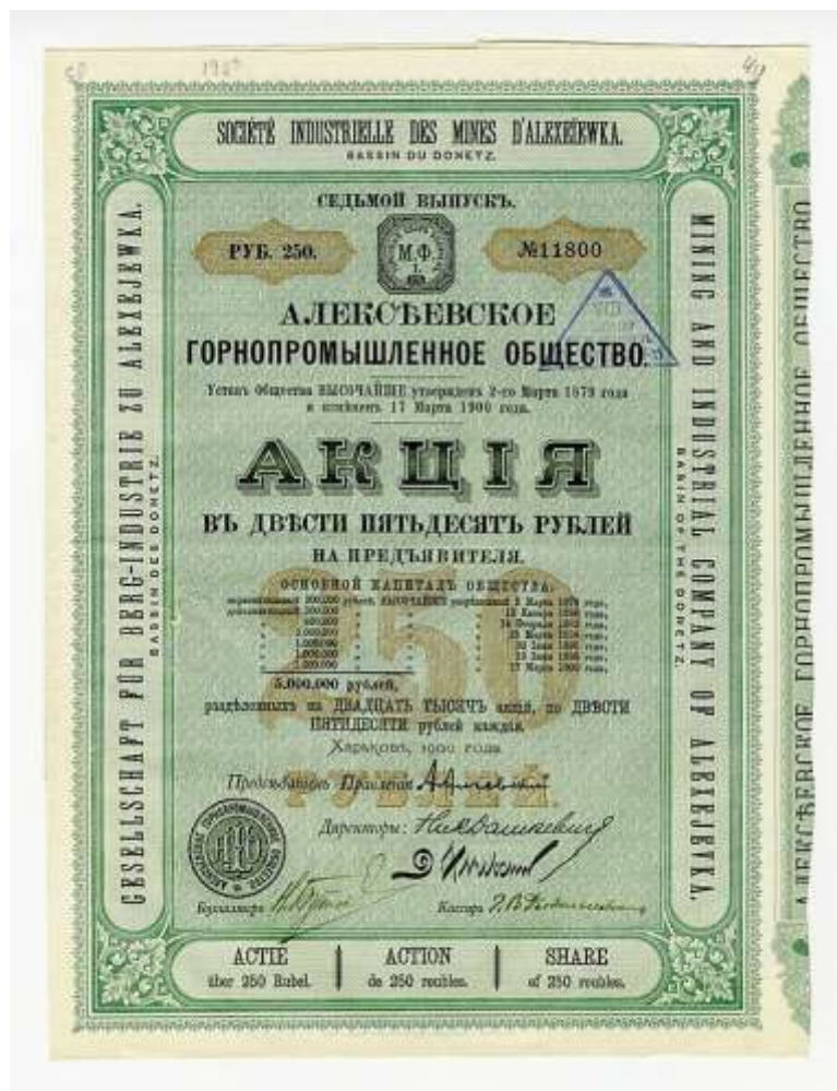
Акция акционерного Алексеевского горнопромышленного общества.

Но наступивший экономический кризис угрожал существованию предприятий харьковского банкира, который изыскивал любые способы, чтобы остаться на плаву.