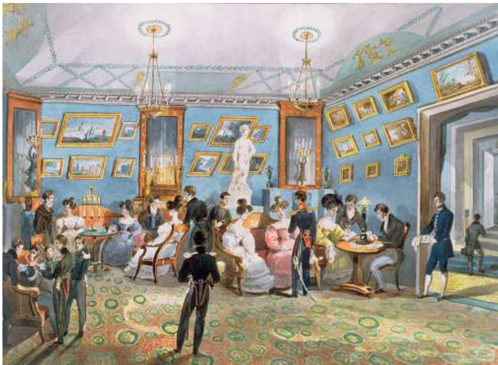
В Петербургских салонах.

Политковский уверенно рос. В 1828 году он получил малоприметное придворное звание камер-юнкер, а в 1836 году военный министр исхлопотал для него звание камергера. Появились и ордена: сначала Святого Владимира 3 степени, затем Святой Анны 1 степени и Святого Станислава 1 степени.