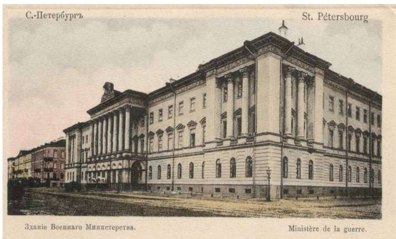
Здание Военного министерства.

Став военным министром, Александр Чернышёв не забывал подталкивать наверх своего протеже, и в июне 1835 года Политковский был назначен директором канцелярии «комитета о раненых» Военного министерства.