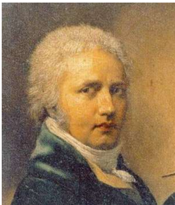
Первый губернатор Сибири князь Матвей Гагарин.

Матвей Гагарин был реальным историческим деятелем. Он действительно с 1711 по 1719 годы был главой Сибирской губернии, в состав которой входило и Нерчинское воеводство. И он действительно был одним из крупнейших коррупционеров или, как тогда говорили, казнокрадов страны. И оказался одним из немногих вельмож, который был Петром I казнён, да ещё как казнён.