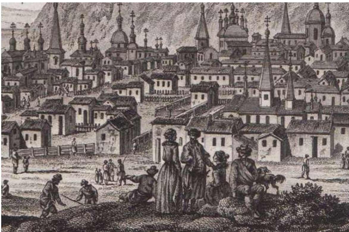
Тобольск, Антикварная гравюра 1783 год.

В 1701 году Пётр I поставил Гагарина на строительство канала между Волгой и Доном. Несмотря на то, что специальных знаний у Матвея Петровича не было, организатором он оказался хорошим и отлично зарекомендовал себя. В 1707 году - очередное важное назначение: Гагарин руководил укреплением Москвы, где ждали шведов, и тоже справился успешно. Пётр доверял ему и в итоге поставил главой Сибирского приказа, и новый хозяин Сибири отбыл в Тобольск.