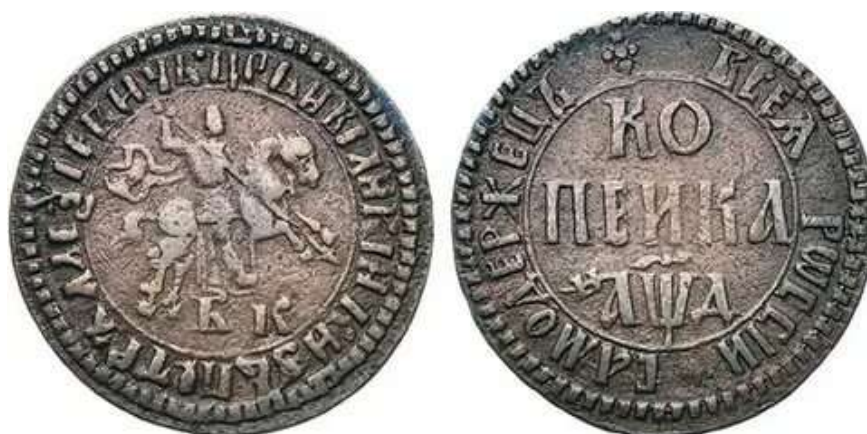
Копейки Петра I.

В 1703 - 1706 годах стали появляться недоимки: это грозило существованию армии и флота. Чтобы как-то получить средства, необходимые для содержания армии и флота, Пётр I начал перечеканку монет. Однако простой перечеканкой иностранной монеты, которая появлялась в России от продажи иностранным государствам казённых товаров, решить проблему не удалось (хотя доход от этого составлял 86 000 рублей), поэтому Пётр ввёл новые монеты. До того времени в России были в ходу только деньги, равнявшиеся полукопейке. Сто таких копеек составляли рубль. Пётр I ввёл разменную медную монету - денежки, полушки и полуполушки и велел начеканить серебряные рубли, полтины, полуполтины, гривенники, пятачки, трёхкопеечники, причём вес этих денег уменьшился. Все наличные деньги из приказов было велено доставить на Денежный двор, откуда вернули в приказы их деньги новой монетой с наддачей в 10% - «по гривне на рубль».