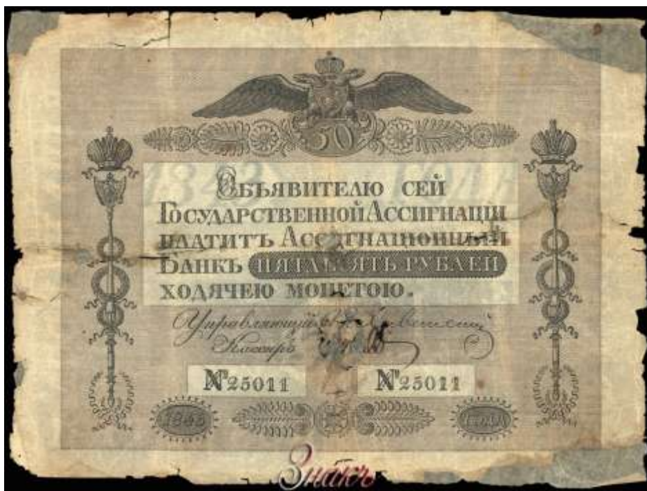
Денежная ассигнация Екатерины II.

Причиной необходимости введения ассигнаций явилось то, что основой денежного обращения был серебряный рубль, который играл роль всеобщего эквивалента и был обеспечен ценой заключенного в нем металла. Но производительность отечественных рудников была недостаточна для обеспечения возросших требований к объему денег в экономике. Ассигнации также использовались для финансирования войны с Турцией.