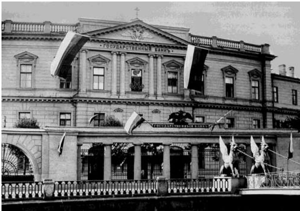
Государственный банк России.

В 1862 - 1866 годах В.А. Татариновым была проведена финансовая реформа. Главным образом реформа была направлена на упорядочение государственного аппарата. В ходе реформы был учрежден Государственный банк, в руках министра финансов были сосредоточены все бюджетные средства, которые до этого времени были рассредоточены по министерствам.