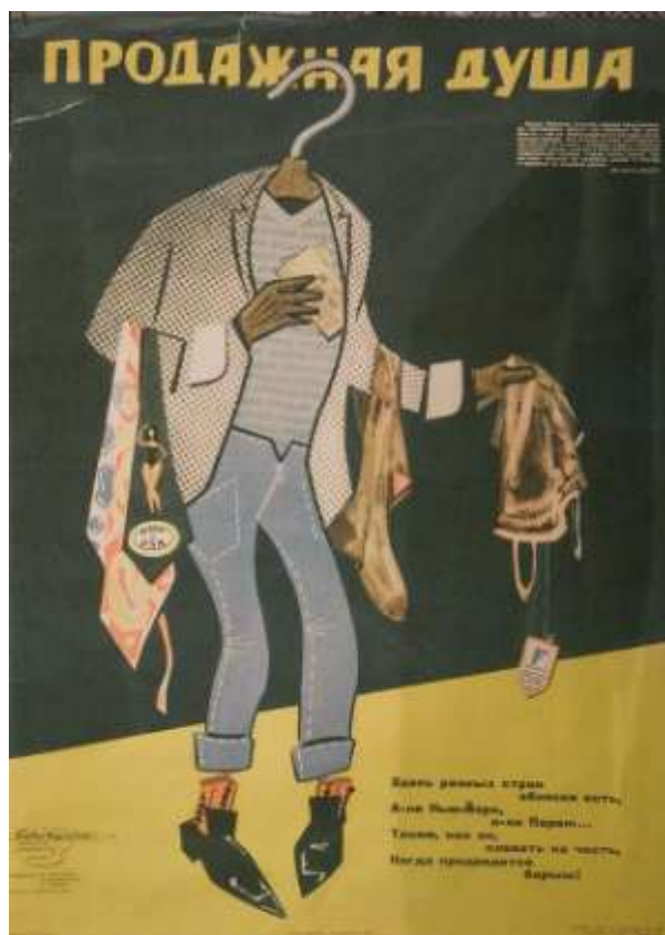
Советский плакат-кариатура на фарцовщика.