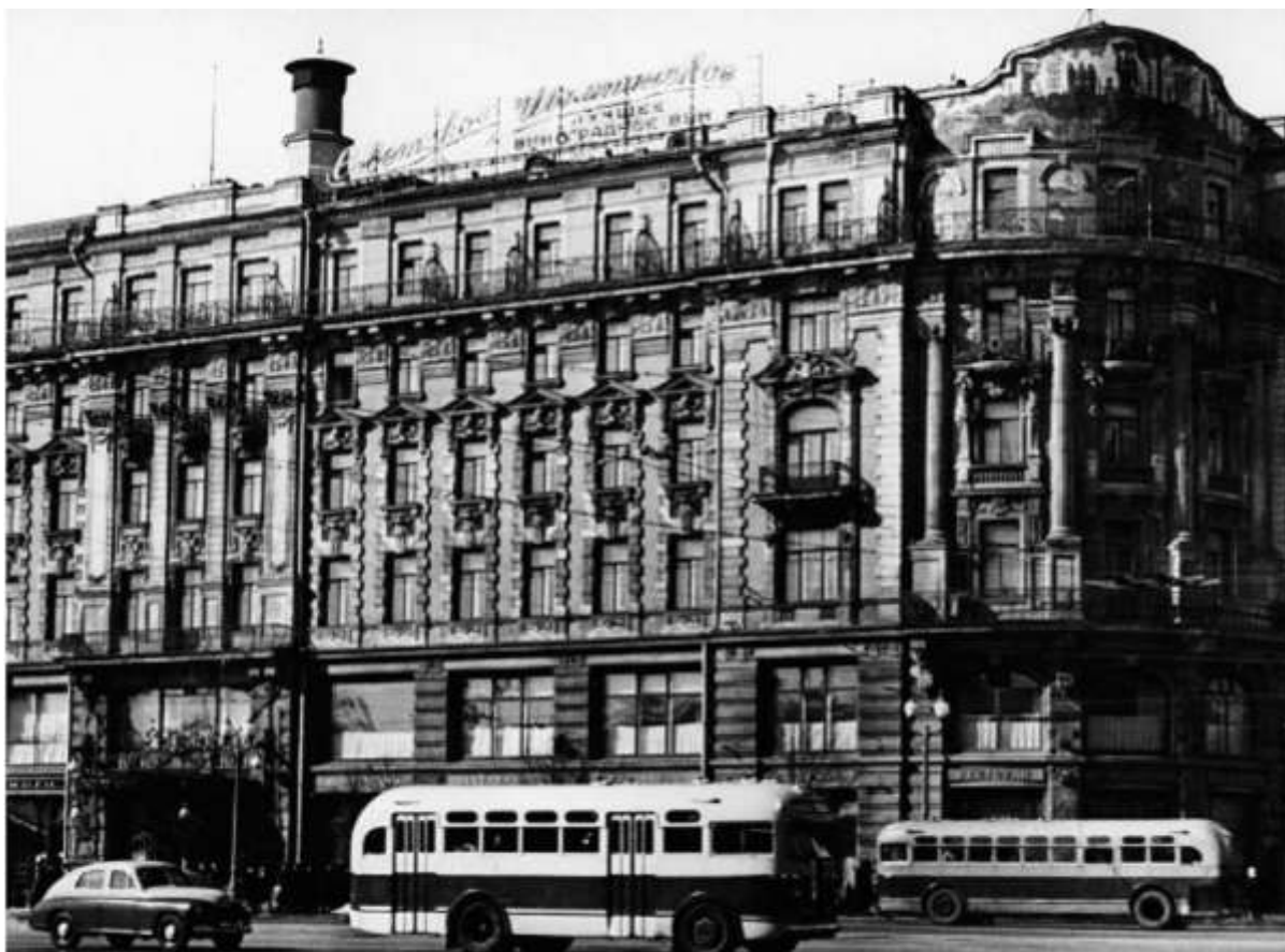
Гостиница «Националь» - «гнездо» московских валютчиков.