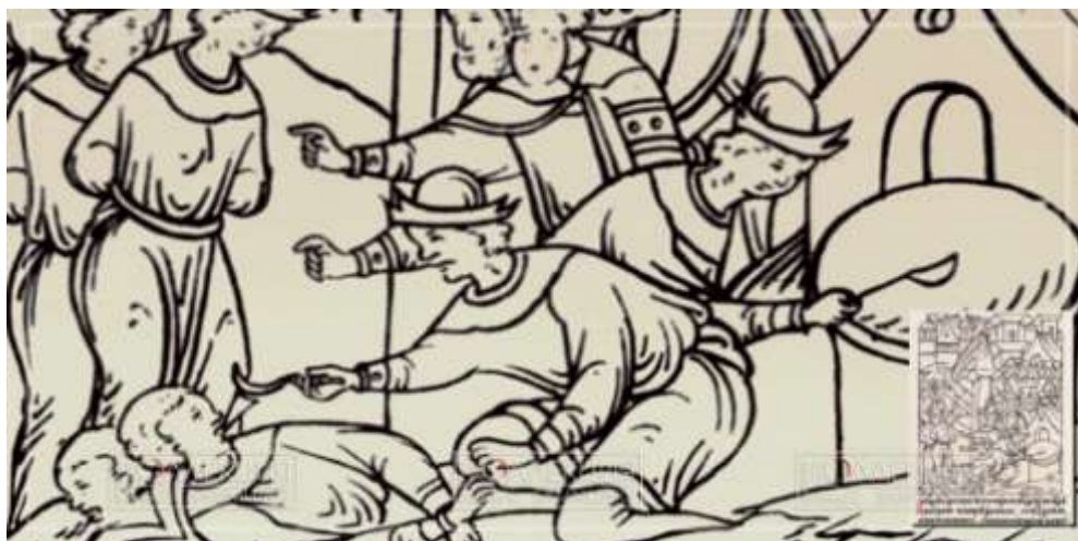
Казнь фальшивомонетчиков на Руси.

На протяжении XII - XV веков на территории русских княжеств основным средством платежа были литые серебряные слитки-гривны, а позднее рубли различных типов и весовых норм, а также их фракции. То, что платёжные слитки могли подделывать, в частности, понижать пробу или целиком отливать из недорогих металлов и сплавов (например, из сплава олова и сурьмы) известно по единичным находкам икладам, а также по немногочисленным сведениям из письменных источников.