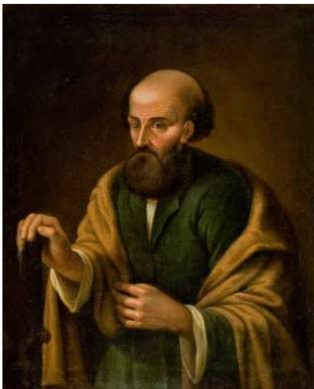
Никита Демидович Антуфьев (1656 - 1725).

Возвышение Демидовых началось при Никите Демидове (1656 - 1725), тульском кузнеце-оружейнике, сумевшем мастерством поразить Петра I и получившем земли на Урале и в Сибири для строительства металлургических заводов, поставлявших по низким ценам военные припасы для казны, и пожалованном в 1720 году в дворянство с фамилией Демидов.