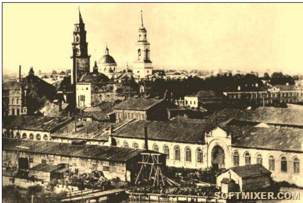
Демидовские заводы на Урале.

Семейные владения занимали 638 тыс. десятин, включали десятки железных и медных рудников, золотые и платиновые прииски, деревни и поселки. Акинфий Демидов стал статским советником, имел дворец в Петербурге. Был благотворителем, подарившим Московскому университету минералогические коллекции.