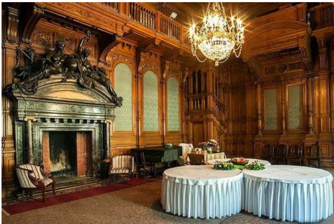
В одном из залов особняка А.А. Половцова.

О том, что двигало этим человеком, что заставляло его неутомимо и последовательно вершить задуманное им дело сказал сам А.А. Половцов в одном из выступлений на торжественном заседании Совета Училища Штиглица, посвященном очередной годовщине создания учебного заведения: «Пускай не одни дворцы и палаты останутся хранителями предметов, увеселяющих глаз, возвышающих душевное настроение; пускай, напротив, всякое жилище русского труженика и семьи его озарится светлым лучом искусства, требующим не драгоценных материалов, хотя бы изобилующих в нашей стране, но исключительно общедоступного в исполнении гармонического сочетания линий и красок. Такова цель стремлений нашего училища. Достигается ли она? Ответ на это дадут соседние залы, наполненные произведениями наших учеников».