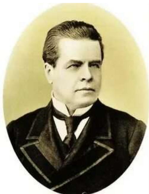
Сенатор Александр Александрович Половцов (1832 - 1909). Российский государственный и общественный деятель, сенатор, промышленник, меценат и коллекционер.

Занимая должность председателя Русского исторического общества в 1879 - 1909 годы, редактировал «Сборник Русского исторического общества».