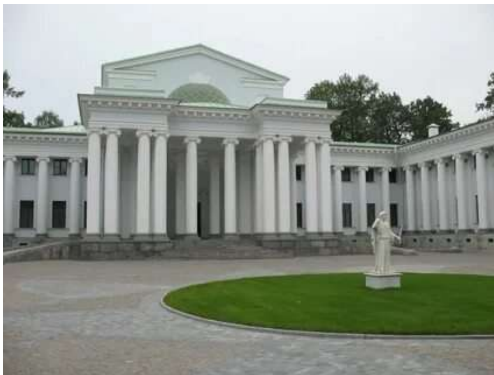
Фасад особняка сенатора Половцова в Санкт-Петербурге.

В середине 1892 года А.А. Половцов был назначен членом Государственного Совета и оставался им вплоть до самой смерти в 1909 году. Его опыт политика был востребован российским государством, вступавшим в новый век и в новую фазу своего развития. Так, в 1902 году он становится членом Особого совещания о нуждах сельскохозяйственной промышленности, а в 1905 - 1906 годах он участвовал в совещаниях по разработке учреждения Государственной думы и реорганизации Государственного Совета в верхнюю палату.