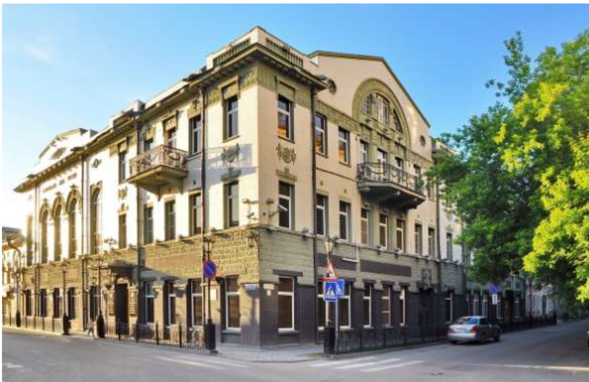
Здание Азовско-Донского коммерческого банка в Астрахани. Дата постройки: 1909 - 1910 годы. В настоящее время в здании размещается Управление Центрального банка РФ по Астраханской области.