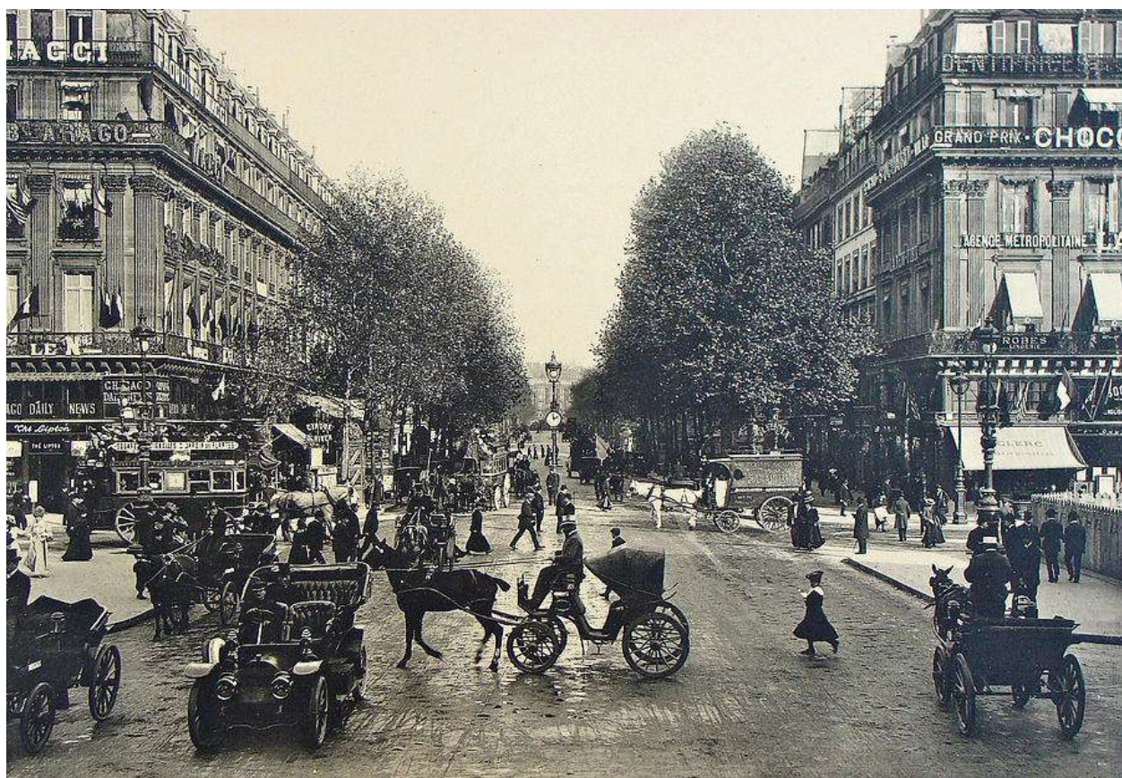
Париж. Фото 1900 годов.