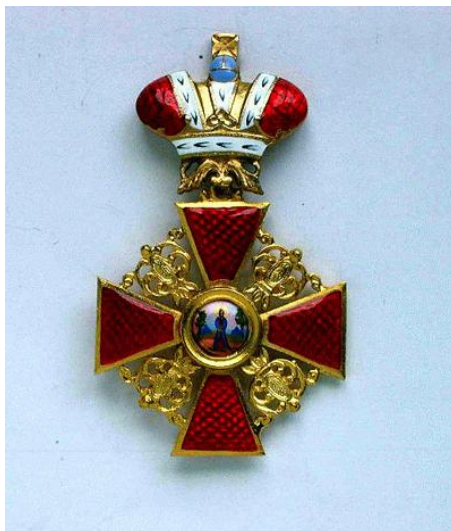
Орден Святой Анны

публично о своих бухгалтерских занятиях. В журнале «Счетоводство» №№ 19-20 была опубликована статья «Объяснительная записка к предварительному проекту положения об институте бухгалтеров».