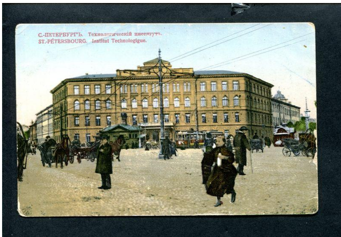
Здание Санкт-Петербургского Технологического института

За усердную службу награжден орденом Святой Анны 2-й степени.