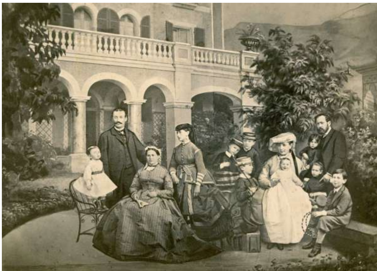
Семейная фотография рода Гинцбургов.