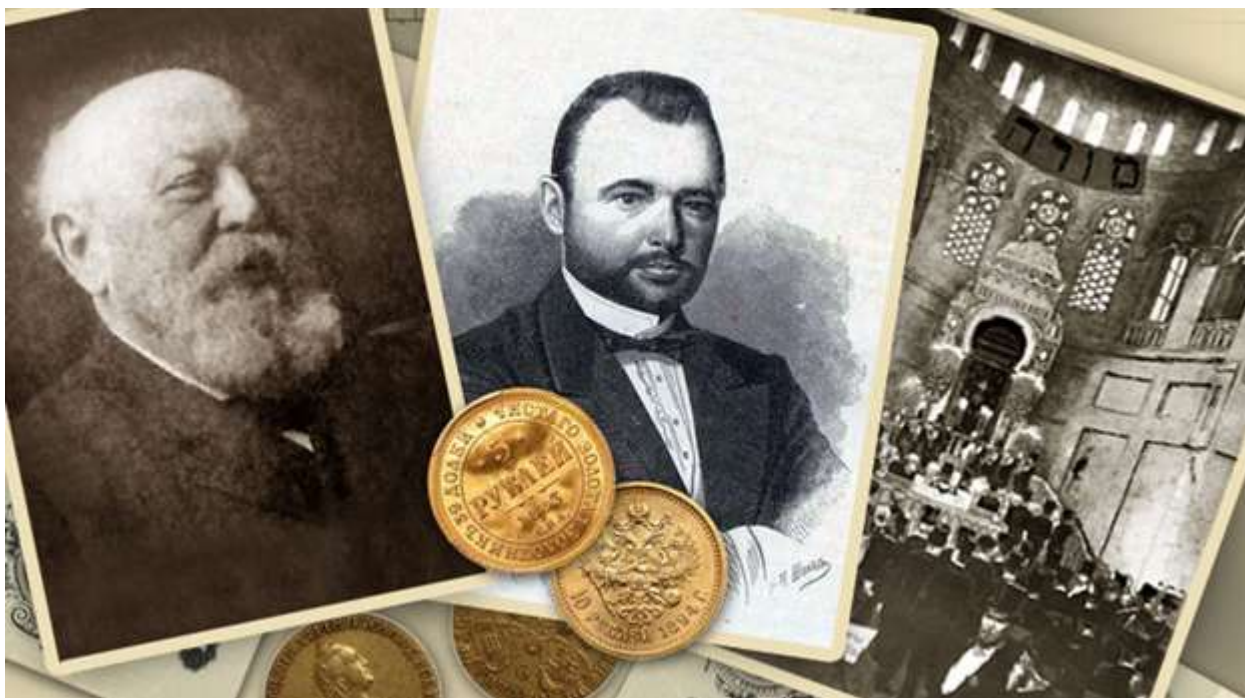
Успешные предприниматели династии Гинцбурга.

Начав свою трудовую жизнь с самых низов, этот витебский еврей первым в России создал банк современного типа, стал именитым бароном, мультимиллионером, крупнейшим землевладельцем. И всем, чего достиг в этой жизни Евзель Гинцбург, он был обязан только собственным способностям, интуиции, деловой хватке. Можно сказать, что этот еврейский самородок создал себя сам. Но следует принять в расчет и то, что в нём выкристаллизировались наследственные качества, передаваемые из рода в род многими поколениями его пращуров.