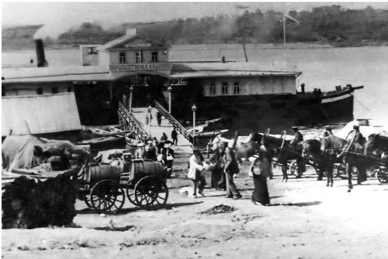
Пристань пароходства Кашиной на реке Оке.

Рыбинск - Тверь ходили пароходы меньших размеров. Кроме того, с открытием москворецких шлюзов появилась товарная линия Нижний - Москва. Фрахт и такса на проезд были дешевле, чем у других крупных пароходств. Небольшие кашинские пароходы заходили буквально чуть ли не в каждое селение, привлекая пассажиров дешевой платой.