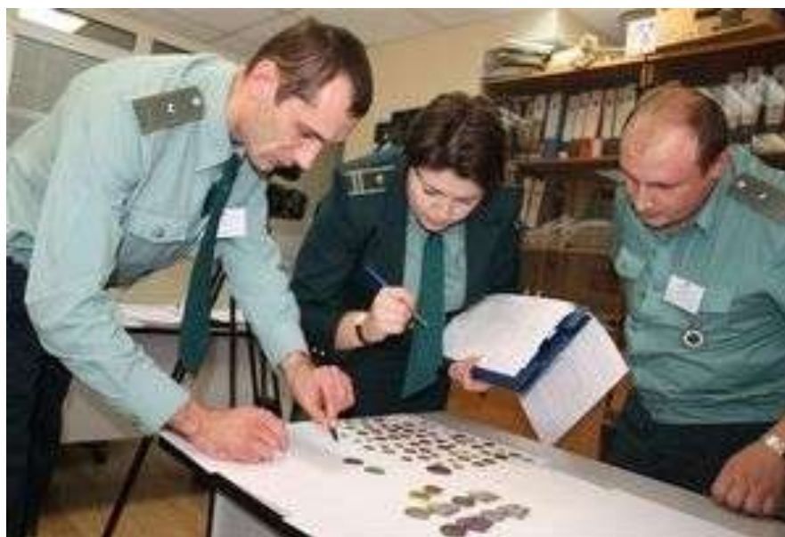
Проверка таможенной декларации.

Наиболее типичным способом незаконного перемещения физическими лицами культурных ценностей является их провоз пассажирами в багаже при следовании автомобильным, железнодорожным и авиатранспортом.