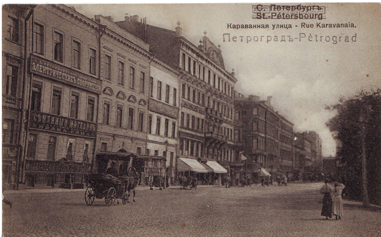
Вид Караванной улицы в Санкт-Петербурге.