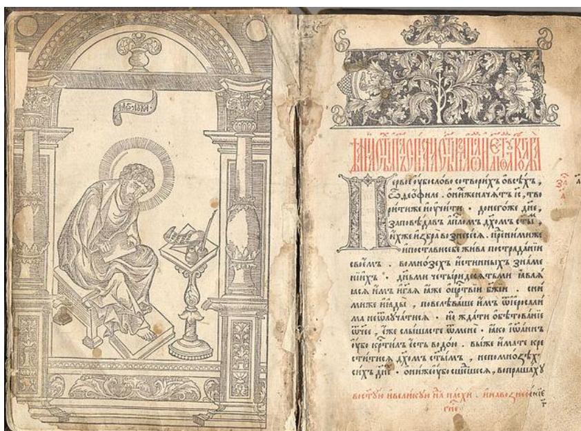
Книга XVI века «Домострой».

Все отмеченные принципы сформировались в допетровскую эпоху. Памятники тех лет сохранили сведения о бухгалтерском учете в государственном хозяйстве, монастырях, строительстве, промышленности и торговле.