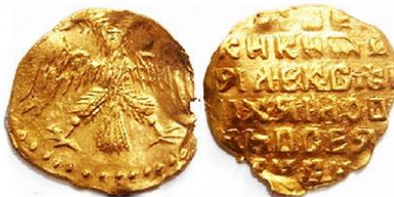
«Жалованная монета – «золотой в четверть золотого» царя Алексея Михайловича.

другим должностным лицам, изымали в бюджет не использованные приказами денежные средства.