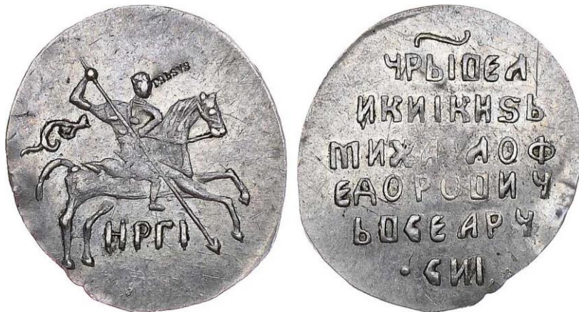
Монеты допетровской Руси.

С начала XVIII века значение монастырей в народном хозяйстве снижается, а в 1764 году их земельная собственность была секуляризирована.