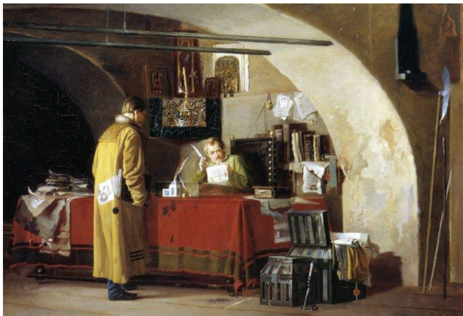
Казначейство в России.

В России хозяйственный учет начал развиваться еще в IX веке в Новгороде. В это же время учет широко использовался князьями, боярами, монастырями и церквями в виде приходно-расходных книг. Были найдены: расходная книга Псковской Завелической церкви Успения за 1531 год, приходно-расходные книги князя Голицына за 1685-1686 годы и другие «учетные регистры» той эпохи.