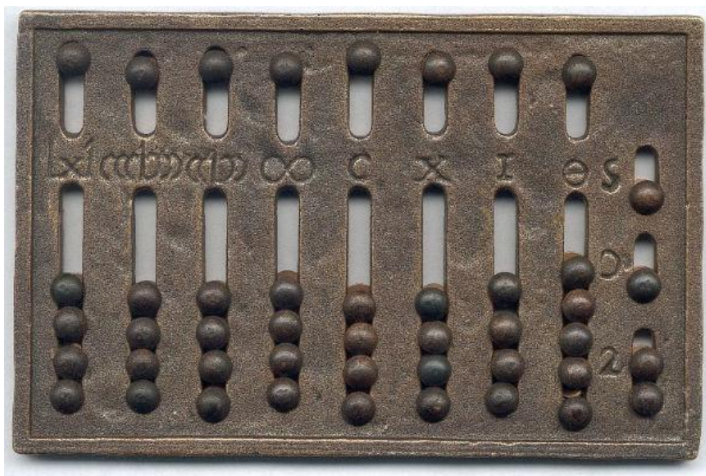
Абак – устройство для арифметических вычислений в Древней Греции

Здесь впервые появляются деньги в виде монеты. Это событие было одним из существенных скачков в развитии учета: деньги выступили сначала как средство проведения расчетов, а затем как мера стоимости. Оценка имущества в денежном выражении становилась преобладающей. Поскольку в учете фигурировали монеты разной чеканки, было три варианта обеспечения их соизмеримости: сначала их складывали по металлу и весу, потом - по видам монет, затем - по их покупательной стоимости.