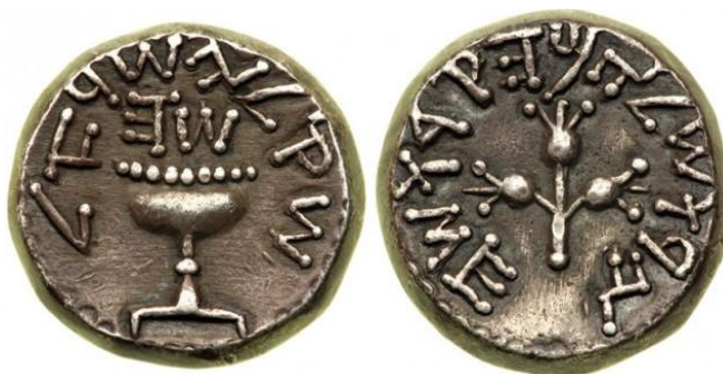
Древние монеты Иудеи и Израиля

В Библии сохранилось высказывание царя Соломона: «С кем постоянно находишься в торговых сношениях - считай и оценивай: что даешь, что получаешь – запиши». В Пасху жрецы Иерусалимского храма не приступали к службе до тех пор, пока «главный бухгалтер» Иудеи не закроет все счета и не составит отчет, и пока этот отчет не получит санкции контрольных органов. Специальная инструкция предусматривала порядок учета пожертвований в храм. Перед алтарем устанавливался сундук, царский контролер вместе с главным жрецом вскрывали замок и подсчитывали «выручку».