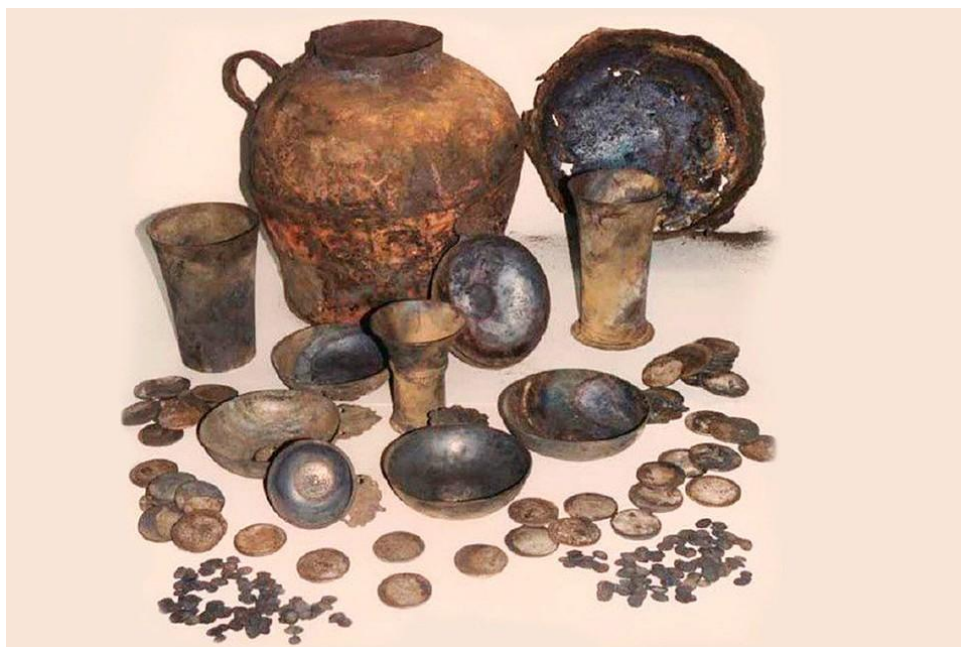
Специальные кувшины для хранения денег на расходы

В государственном хозяйстве регистрировались не только факты поступления и выдачи денег, здесь встречались и зачетные платежи, и переводы платежей в другие кассы. Хранение денег было своеобразным. На каждый вид расходов открывался отдельный кувшин, которому присваивался буквенный индекс. На конкретные расходы можно было брать деньги только из строго определенного кувшина. И, наконец, любопытная деталь: ключ от кассы находился у одного чиновника, а ключ от помещения, где хранилась документация, - у другого чиновника, причем запрещалось обмениваться этими ключами.